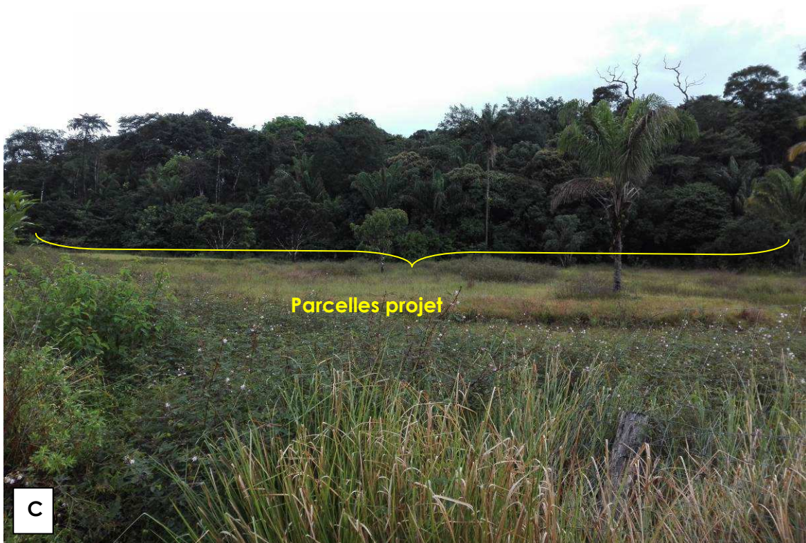
Figure 3 : Vue depuis le chemin de Paramana