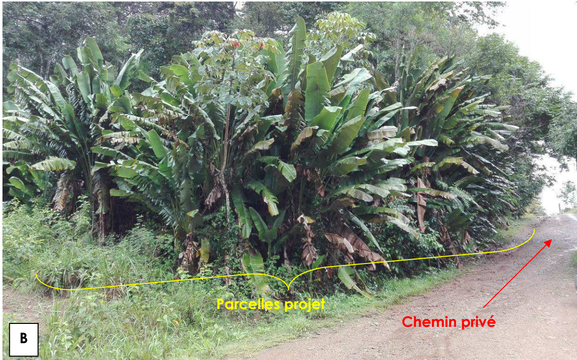
Figure 2 : Vue depuis le chemin privé longeant la parcelle AO115