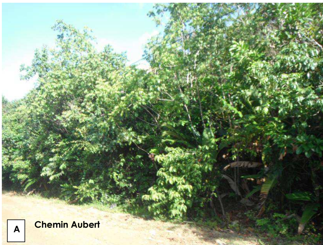
Figure 1 : Environnement proche : Vue depuis le chemin Aubert

Planche photographique (Les prises de vues sont localisées sur le plan en annexe 5)