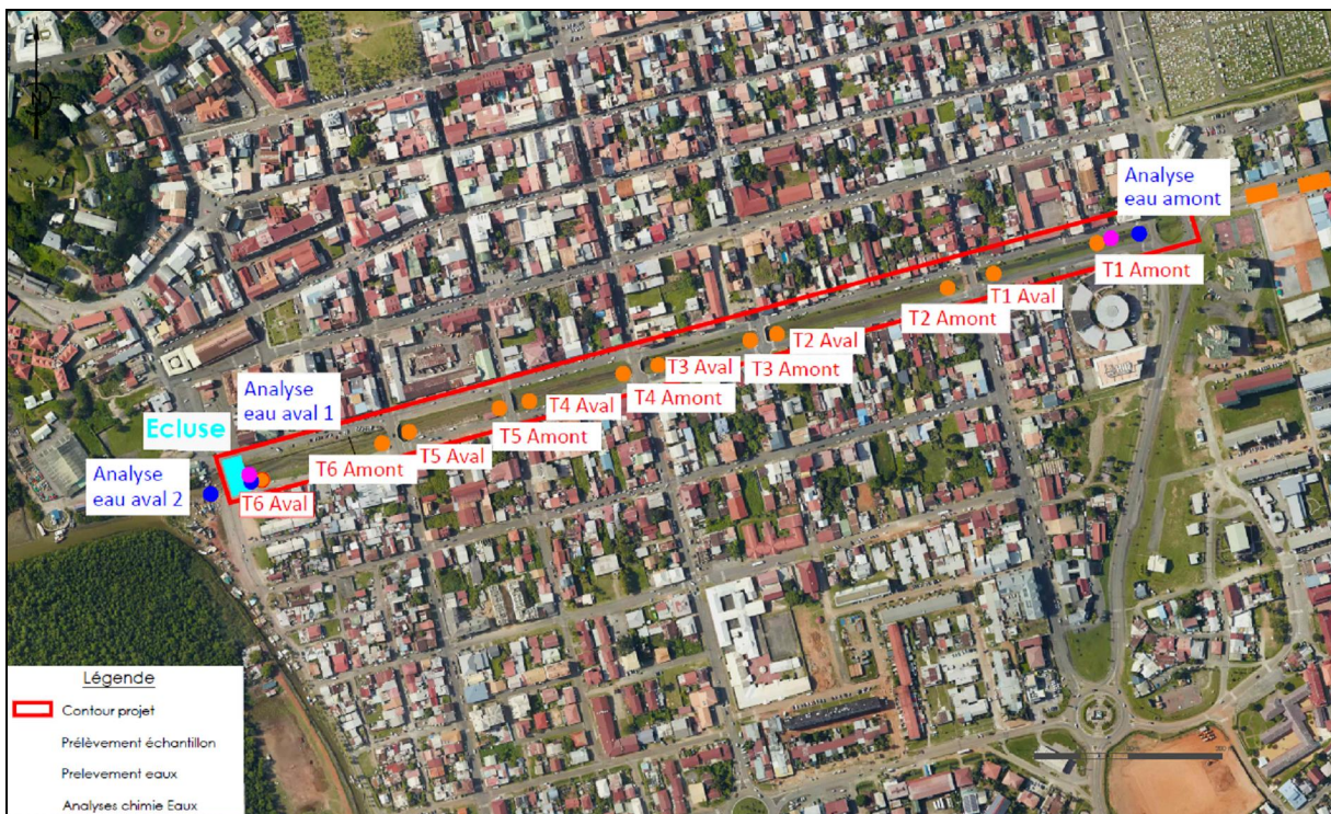
Figure 3 : Points de prélèvement (sédiments, lixiviats et écotoxique) au droit du fossé Galmot

Le tableau suivant présente les analyses réalisées et les méthodes d'analyse utilisées par le laboratoire.