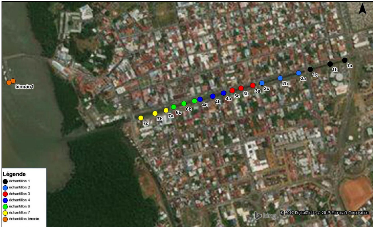
Figure 2 : Plan de situation et dénomination des prélèvements S1