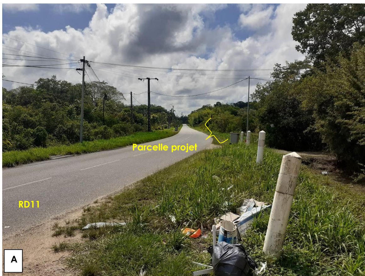
Figure 1 : Vue lointaine depuis la RD11 en direction de Saint-Jean du Maroni

Planche photographique (Les prises de vues sont localisées sur le plan en annexe 5)