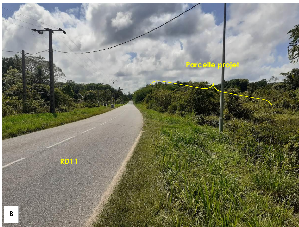
Figure 2 : Vue rapprochée de la parcelle depuis la RD11