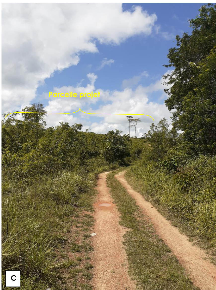
Figure 3 : Vue de la piste existante permettant l'accès sur la parcelle depuis la RD11