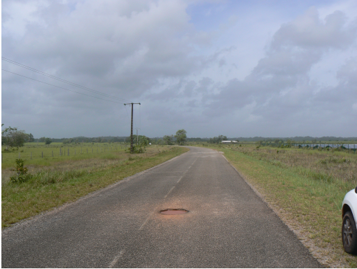
Route de Saint Elie depuis la RN1