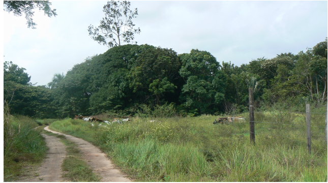
Figure 3 : Parcelle n°105 section AO vue depuis le Chemin Conneau (photos)

Présence de déchets « sauvages » à proximité de la parcelle n°105 (carcasses de véhicules visibles au-delà de la clôture de la parcelle)