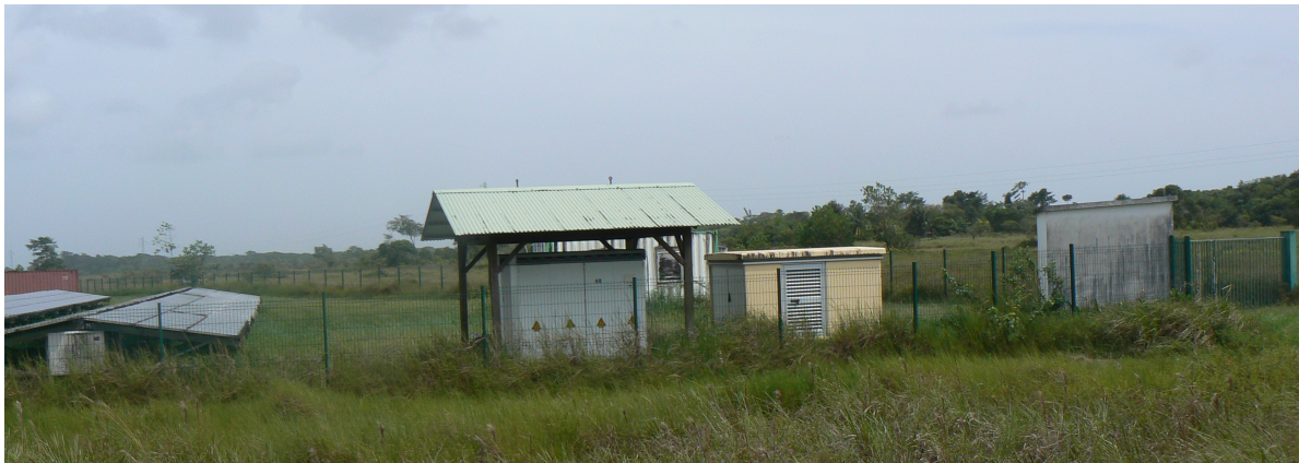
Figure 4 : Vues des installations du parc photovoltaïque de la Savane de Corossy (photos)