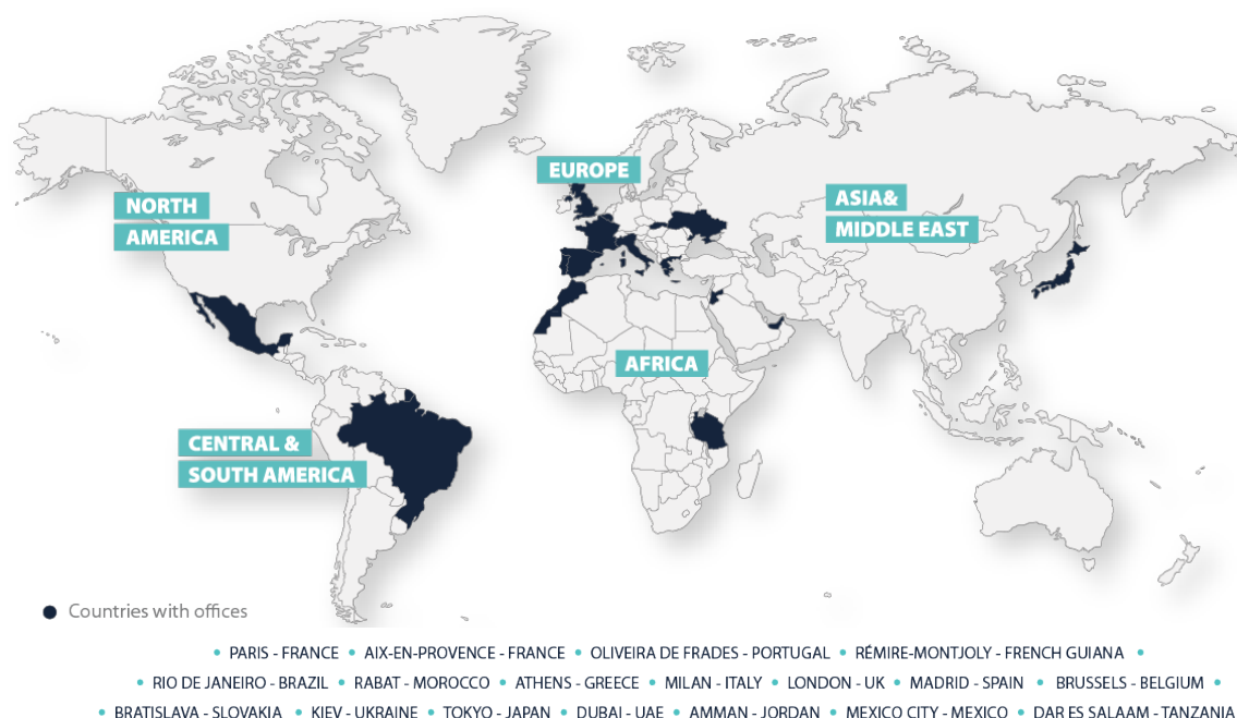
Figure 2 : Présentation du Maître d’Ouvrage - Voltalia

Le groupe Voltalia est présent dans 17 pays à travers le monde.