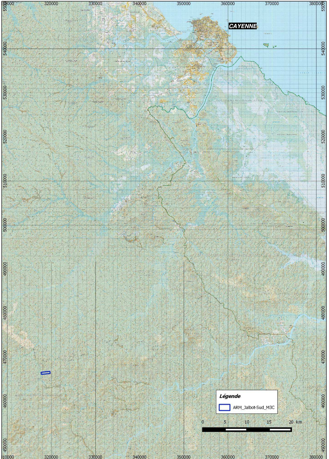
ANNEXE 2a : Plan de situation de l'ARM « crique Jalbot Sud » de MINES 3C d'après la carte IGN au 1/350 000° en RGFG95, UTM22