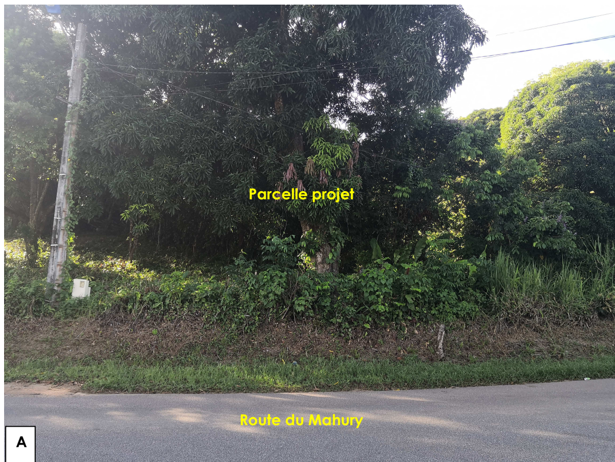
Figure 1 : Vue de la parcelle depuis la route du Mahury

(Les prises de vues sont localisées sur le plan en annexe 5)