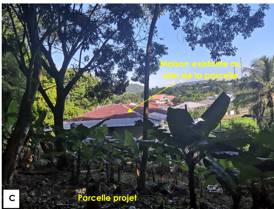
Figure 3 : Vue de la maison existante à l'extrémité ouest de la parcelle projet