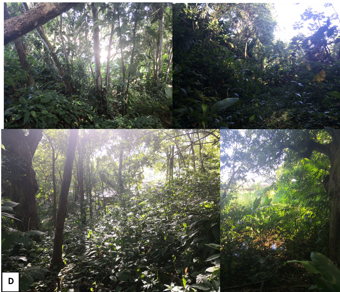
Figure 4 : Végétation au sein du site d'étude