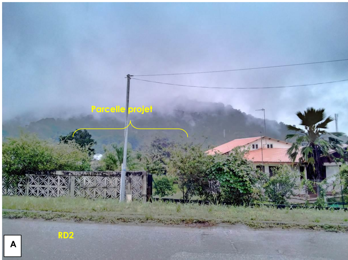
Figure 1 : Vue lointaine depuis la RD2 en direction du mont Cabassou

(Les prises de vues sont localisées sur le plan en annexe 5)