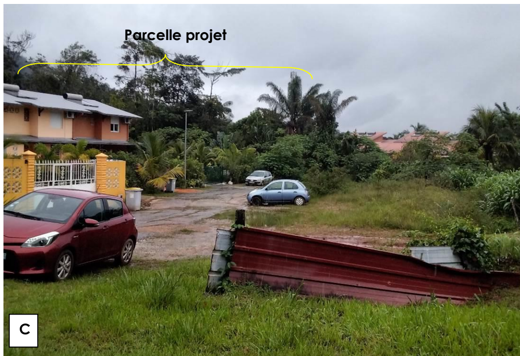
Figure 3 : Vue rapprochée depuis le lot. Bois Précieux au Nord