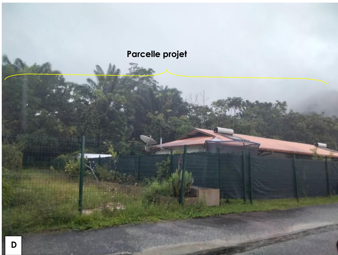
Figure 4 : Vue rapprochée depuis le lot. Bois d'Ambre au Sud