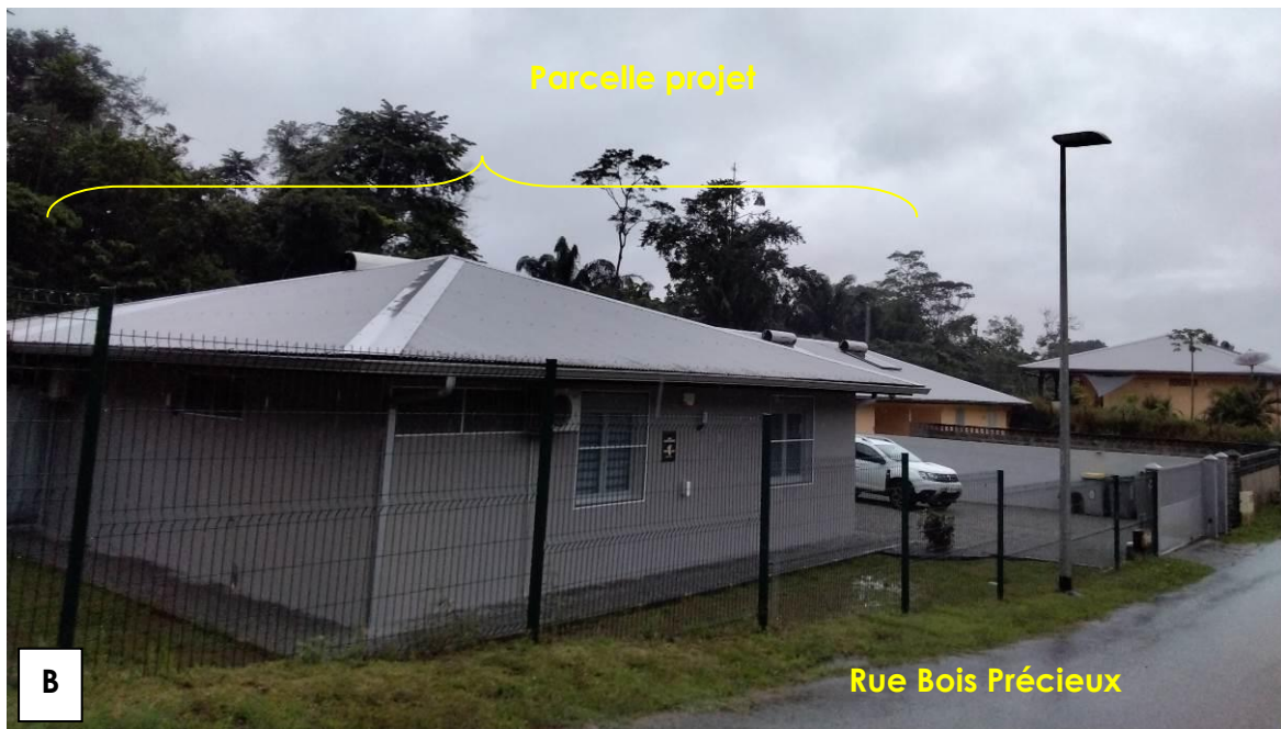
Figure 2 : Vue rapprochée de la parcelle depuis le lot. Bois Précieux au Nord