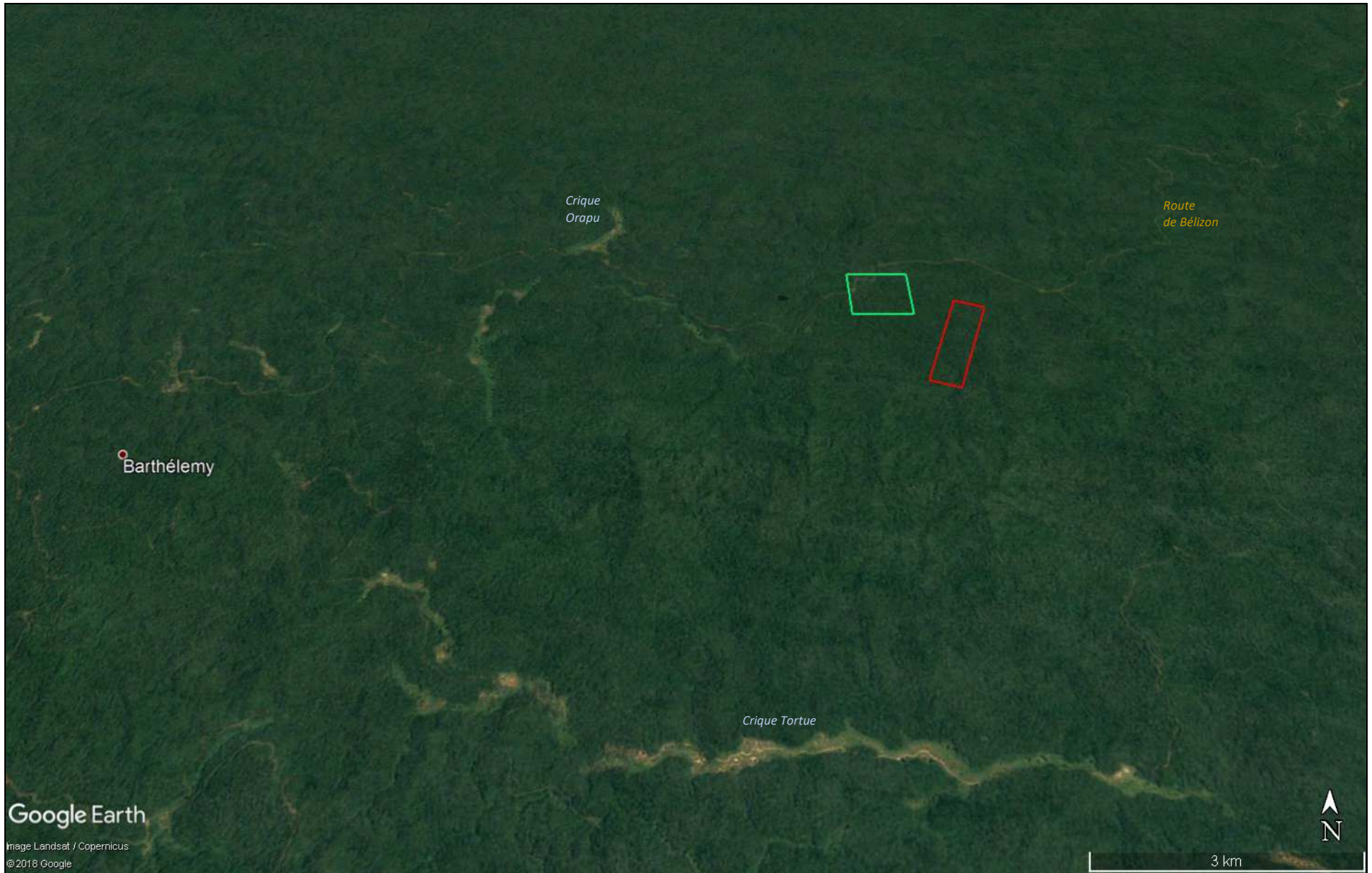
Vue satellitaire globale de l'ARM crique Grillon de 2 km 2 , SARL DOMIEX