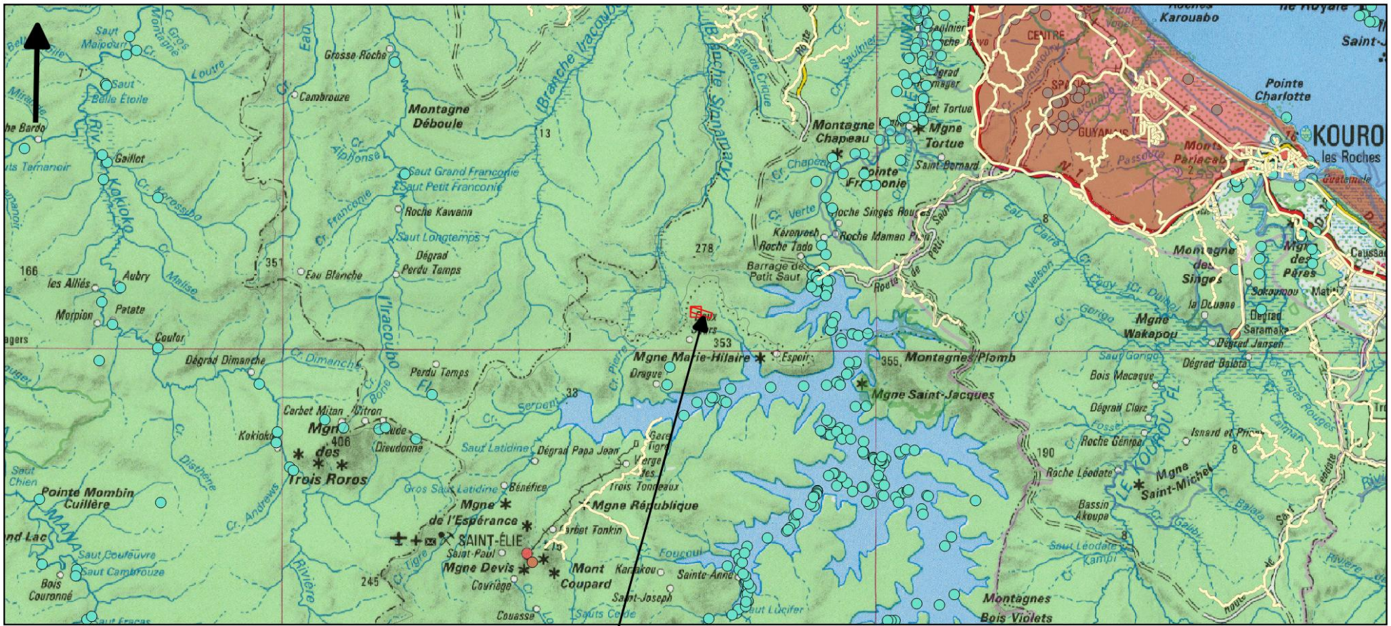
Carte de situation du projet- Commune de Saint Elie/Sinamarv - IGN au 1/500 000