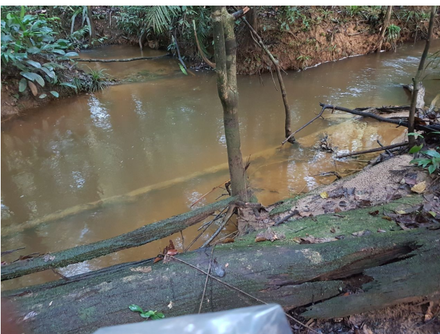
Crique Amont AEX Ouest