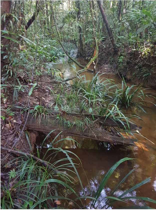
crique aval AEX Est