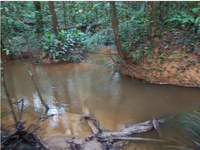
crique centre (entre les 2 AEX)