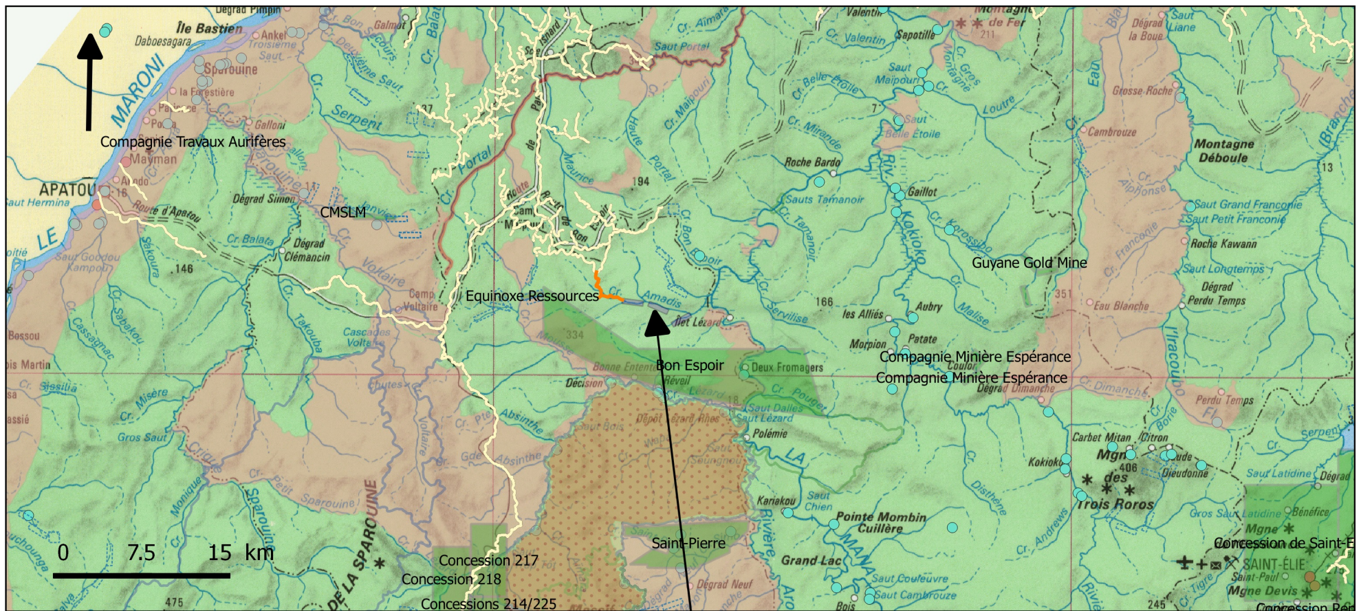
Carte de situation du projet- Commune de Saint Laurent Du Maroni - IGN au 1/500 000