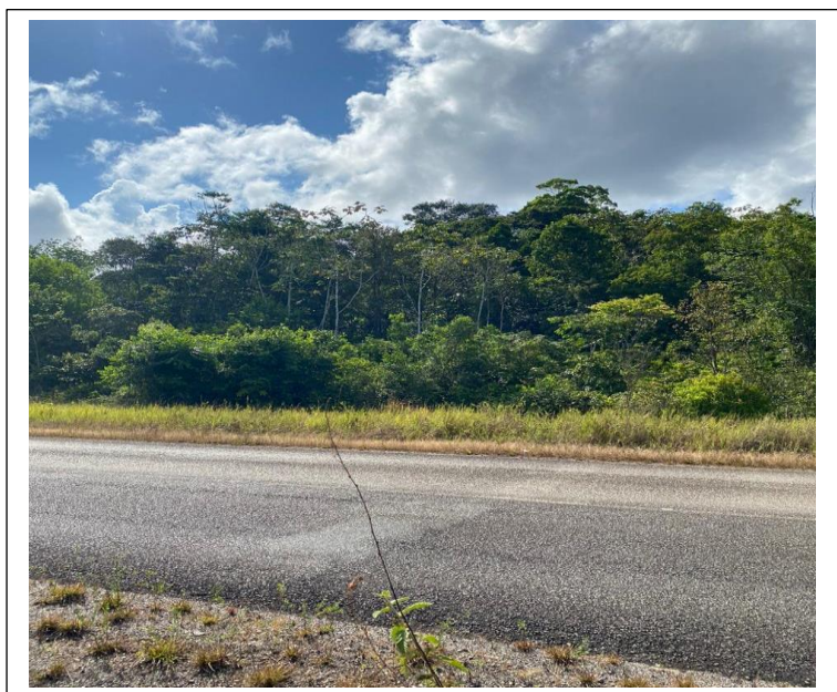
Photo 1 Environnement lointain

Date : demande déposée dès réception du récépissé.