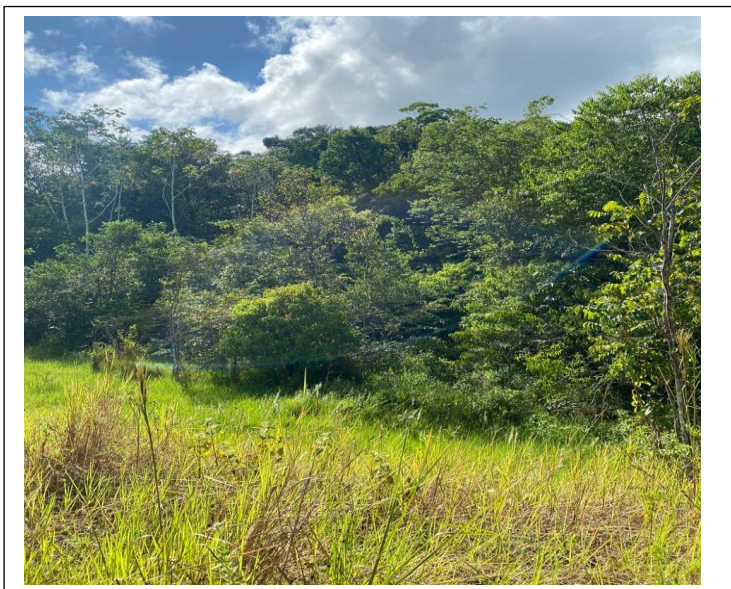
Photo 3 Environnement proche