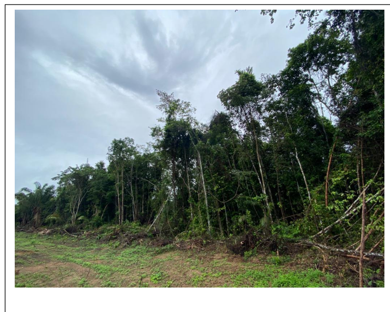
Photo 2 Environnement proche