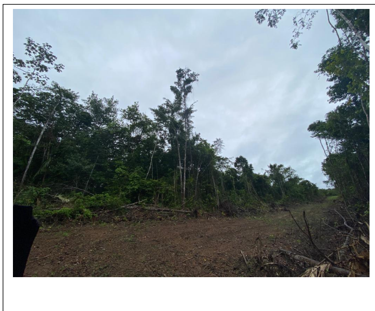
Photo 1 Environnement lointain

Date : demande enregistrée à France-Domaine le 2 juin 2020.