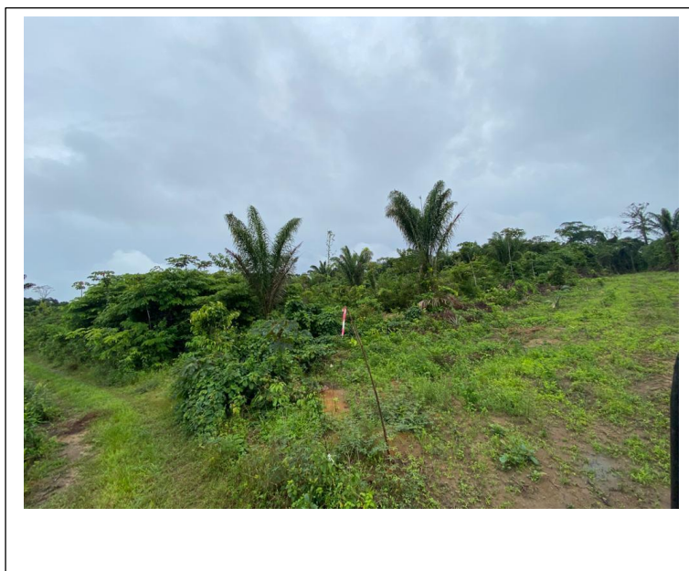
Photo 1 Environnement lointain

Date : demande enregistrée à France-Domaine le 2 juin 2020.