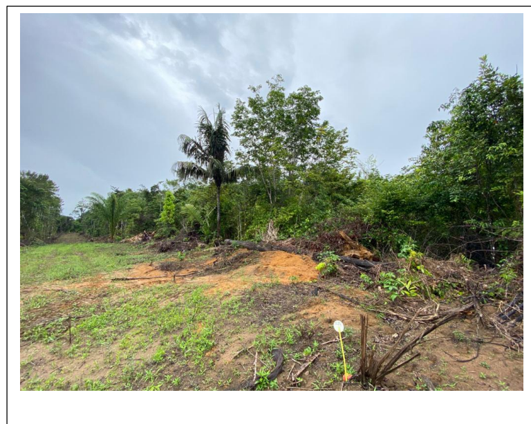
Photo 2 Environnement proche