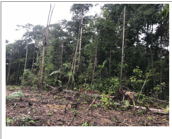
Photo 3 Environnement proche