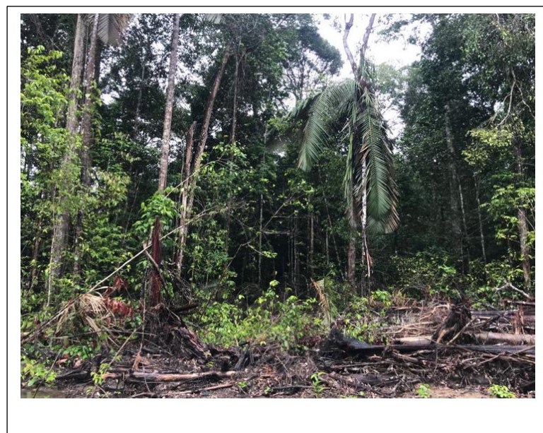
Photo 2 Environnement proche