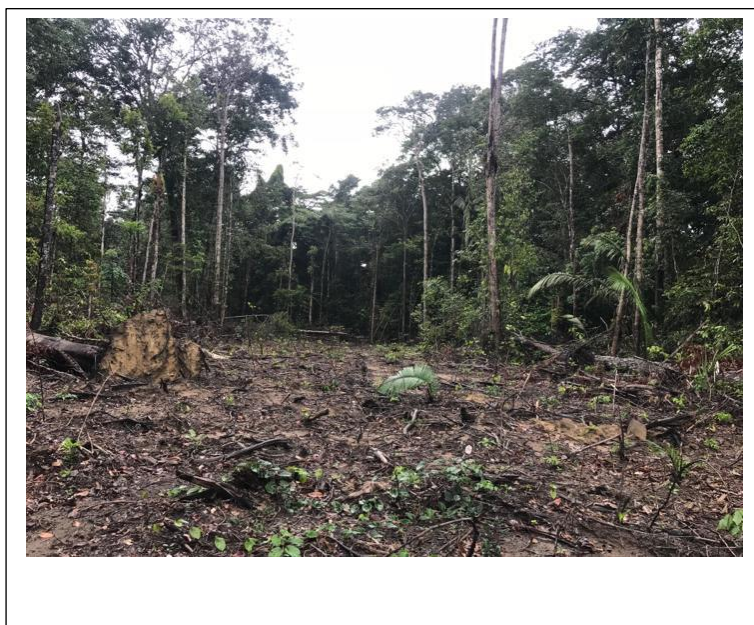
Photo 1 Environnement lointain

Date : demande enregistrée à France-Domaine le 2 juin 2020.