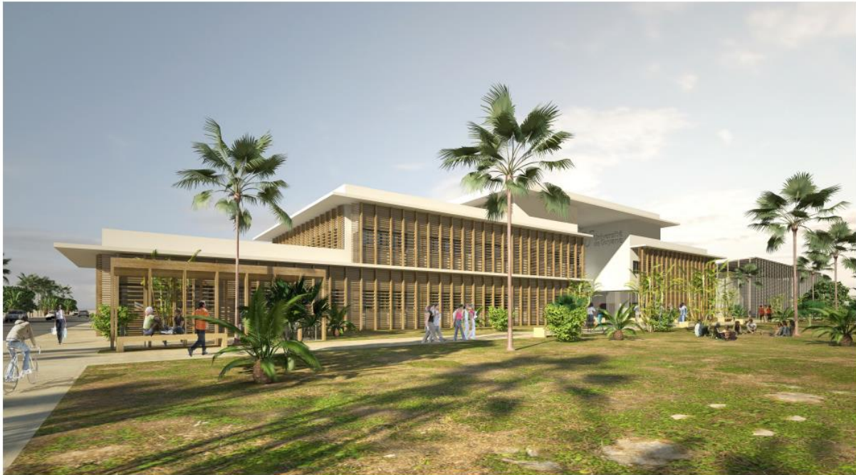
Figure 4 : Aperçu de l'implantation paysagère et architectural du projet de bâtiment centre de ressources et recherche

Concernant l'aspect sanitaire, la gestion des eaux pluviales sera assurée par un réseau bien dimensionné qui permettra d'éviter la création de zones d'eaux stagnantes (voir étude hydraulique).