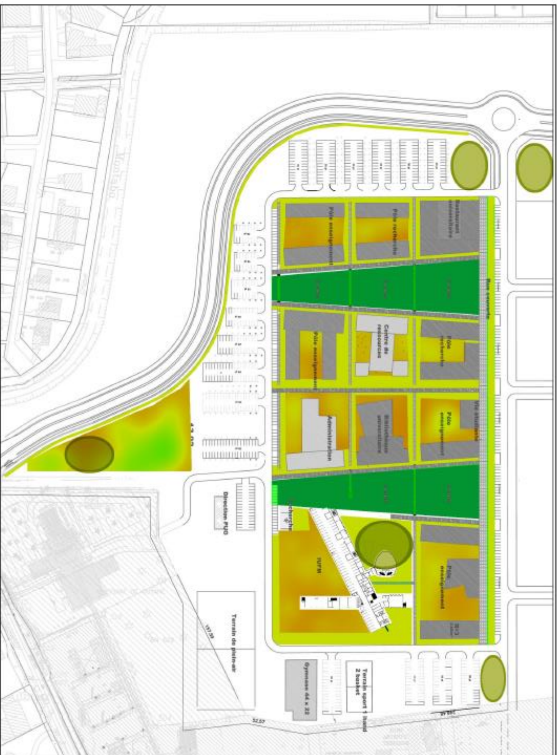
Figure 1 : Plan de l'aménagement paysager

Les espaces publics jouent à la fois de l'unité par la création de deux grands jardins esplanades mais aussi de la diversité par la création de petits jardins thématiques d'îlots.