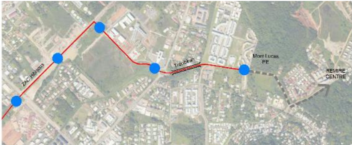
Figure 2 :

Le plan suivant présente le tracé du projet de Transport en Commun en Site Propre (TCSP) :