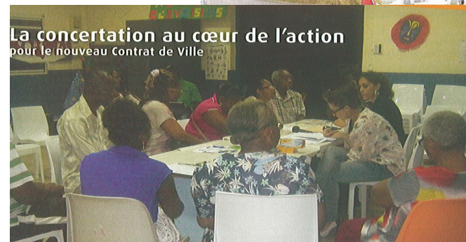
La concertation au cœur de l'action pour le nouveau Contrat de Ville