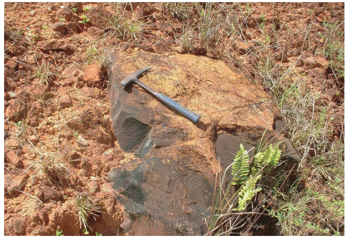
BRGM - H. Théveniaut - 2004

Le profil latéritique n'est pas complet car il faudrait une « entaille » de près de 50 m de profondeur pour pouvoir l'observer. A l'arrière du Lycée, nous sommes principalement dans la partie supérieure de la saprolite qui est la zone altérée meuble ayant conservée les structurations initiales.