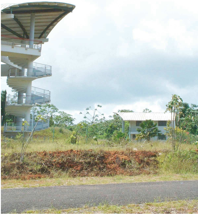
BRGM - H. Théveniaut - 2004