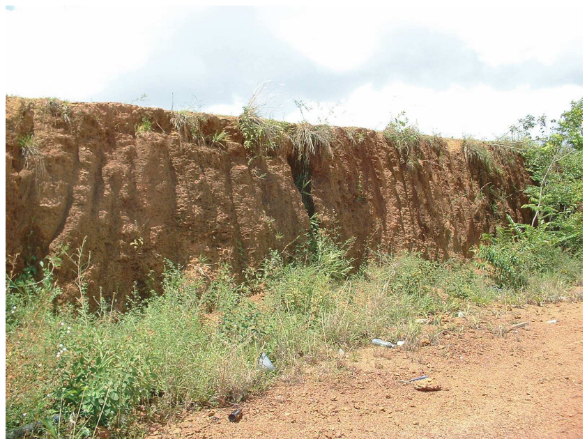
BRGM - H. Théveniaut - 2004