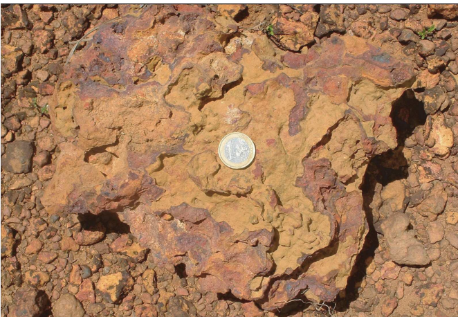
BRGM - H. Théveniaut - 2004

L'argile tachetée peut se voir par endroits avec la matrice jaune argileuse et les débuts de concrétions ferrugineuses.