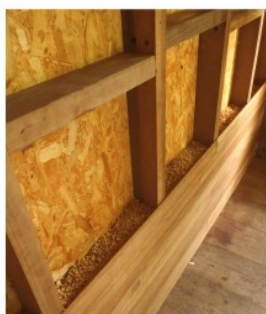
Liège en place dans l'ossature bois