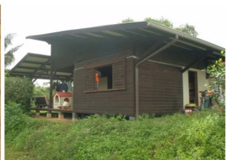
L'extension terminée !

Pour toute question ou information, nous sommes à votre disposition :