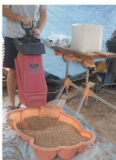
Broyage du liège

Sébastien et Aurélie, 1000 bouchons pour Emile - http://1000bouchons.pagesperso-orange.fr/index.html