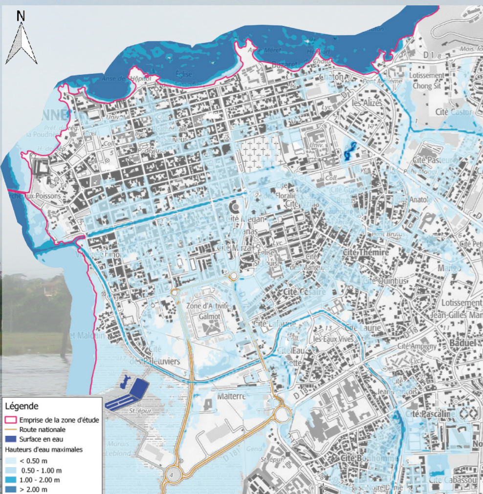
Données Artelia : scénario débordement de cours d'eau et ruissellement pluvial, évènement fréquent (10 ans)